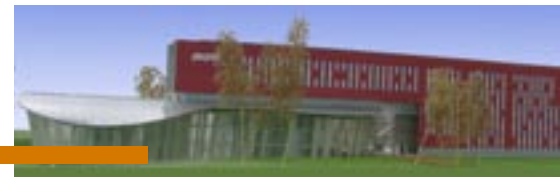
Avans Hogeschool Breda incl. WKO toepassing