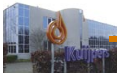
Nieuwe locatie Roosendaal