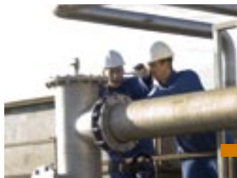
Rendac te Son

Kuijpers Piping & Procestechniek uit Helmond heeft de activiteiten van Cardol Process Systems (CPS) te Druten voortgezet. De overname van de activiteiten door Kuijpers Piping & Procestechniek betekent een verdere versterking van de marktpositie op het gebied van piping werkzaamheden in Oost-Nederland. Om tevens dichterbij haar klanten in het Westen van het land te opereren, breidt Kuijpers Piping & Procestechniek B.V. uit Helmond haar activiteiten uit door middel van een vestiging in Roosendaal.