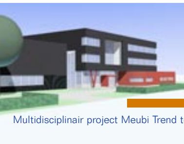
Multidisciplinair project Meubi Trend te Oss

Actuele opdrachtgevers en projecten: • Musiskwartier, Arnhem • Regionaal Gezondheidscentrum, Venlo • Faculteit der Diergeneeskunde, Utrecht • Franciscus Ziekenhuis, Roosendaal • Intervet, Boxmeer • Organon N.V., Oss • DMV, Veghel • Avans Hogeschool Tilburg en Breda • AIVD, Zoetermeer • Verpleeghuis Graafzicht, Bleskensgraaf • Hoofdkantoor Ernst & Young, Amsterdam • Wereldmuziekcentrum, Rotterdam • Meubi Trend, Oss • ROC Nijmegen, Nijmegen • Stadsschouwburg, Haarlem • TBP Electronics, Dirksland • TBV Wonen, Tilburg • Vredespaleis, Den Haag