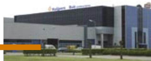
Nieuwe locatie Den Haag (Ypenburg)

Door de sterke groei in de afgelopen jaren zijn twee locaties van Kuijpers Installaties verhuisd. Kuijpers Installaties Den Haag en Buis Lichtreclame zijn verhuisd binnen Den Haag, Kuijpers Installaties Moerdijk is verhuisd naar Roosendaal.